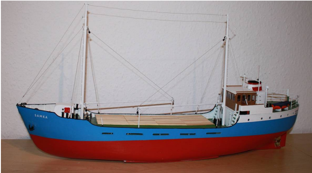
MS SAMKA (1956)