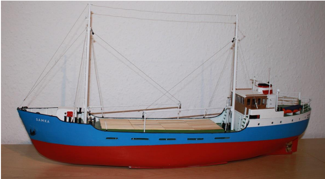
MS SAMKA (1956)